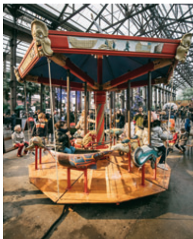
NOËL AUX NEFS 2022. LES MACHINES DE L'ÎLE

Partout en ville, musées et autres lieux d'exposition proposent un programme riche pour des moments de découverte et de partage. Informations, horaires et tarifs sur www.levoyageanantes.fr