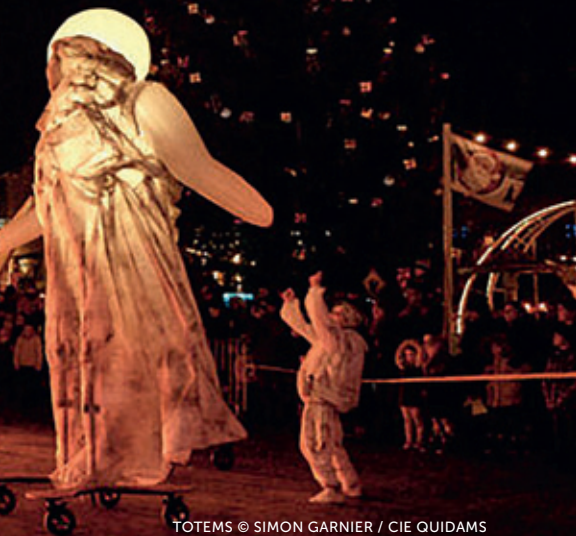
TOTEMS © SIMON GARNIER / CIE QUIDAMS

Boulevard de la Prairie-au-duc, départ allée Susan-Brownell-Anthony