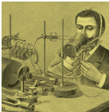
LOUIS POYET, INSTRUMENTS DE LA MÉTHODE GRAPHIQUE DE ROUSSELOT POUR LES ÉTUDES PHONÉTIQUES. CYLINDRE ENREGISTREUR DE MAREY, 1892.