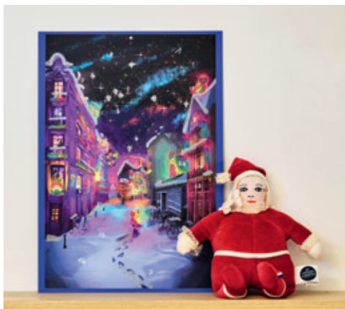
POUPÉE PETITE MAMAN NOËL ET CALENDRIER DE L'AVENT, LA NUIT JE VOIS, VINCENT OLINET

Cartes cadeaux : une visite en famille, entre amis ou pas, une nuit dans une microarchitecture. En vente au bazar officiel du Voyage.