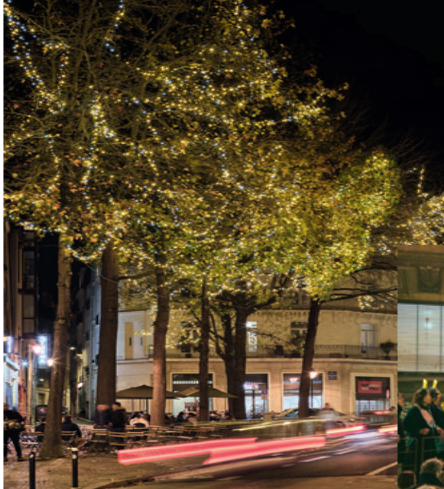
ILLUMINATIONS © DR. CHORALE Y BIRDS X LE VOYAGE À NANTES, LE VOYAGE EN HIVER © DAVID GALLARD / LVAN