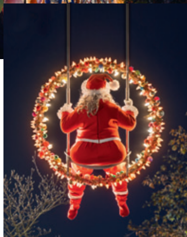
VIRGINIE BARRÉ, PETITE MAMAN NOËL

Ateliers et animations pour petits et grands. Les mercredis et les week-ends.