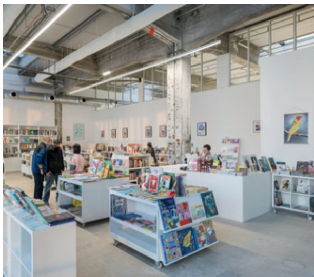
LIBRAIRIE, HAB GALERIE, LE VOYAGE À NANTES