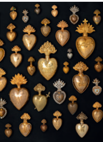
CŒURS DE DÉVOTION, DIOCÈSE DE NANTES