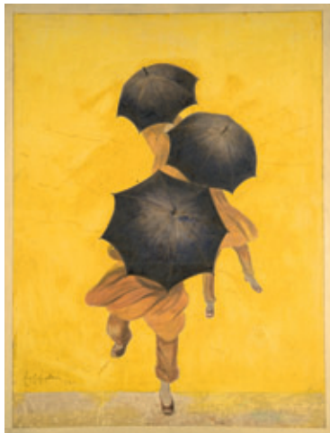
LEONETTO CAPPIELLO, LES PARAPLUIES REVEL . MAQUETTE DE REPRODUCTION, 1922. LYON, MUSÉE DES BEAUX-ARTS