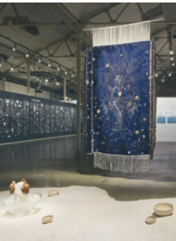
VUE DE L'EXPOSITION DANS LES PLUS DES CARTES