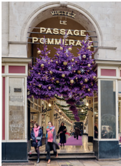
PASSAGE POMMERAYE, 2024